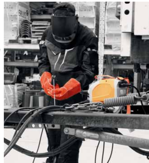
BOOSTER2 lors d'une réparation. Toujours fiable et prêt à l'emploi.